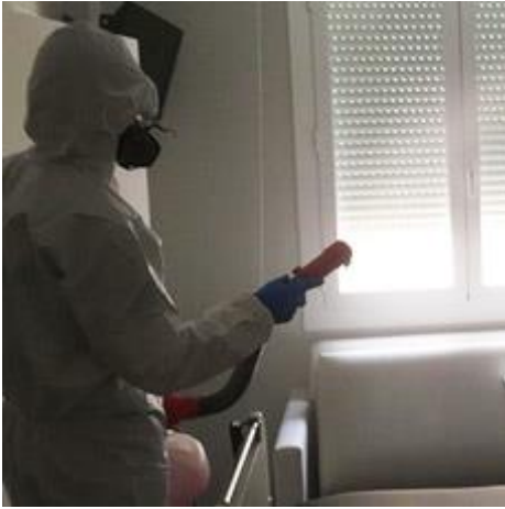
Servicio de desinfección.