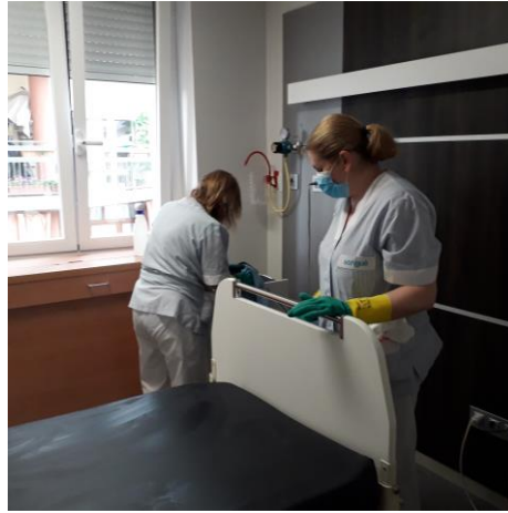
Servicio de limpieza.