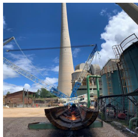
Desballestament mitjançant oxtall de calderí.