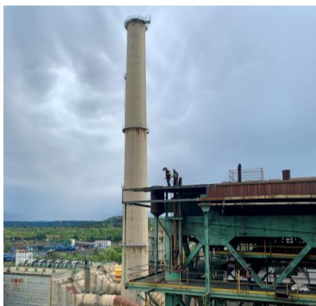
Desmuntatge elements coberta