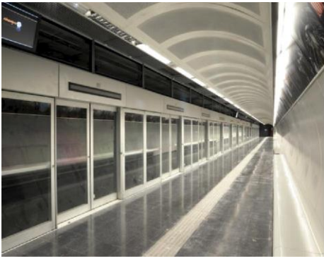
Andana de l'estació de Fondo.