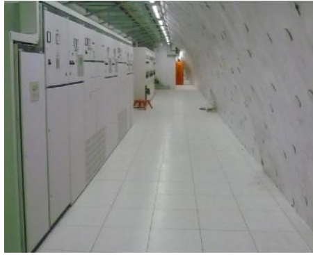
Sala de quadres elèctrics.