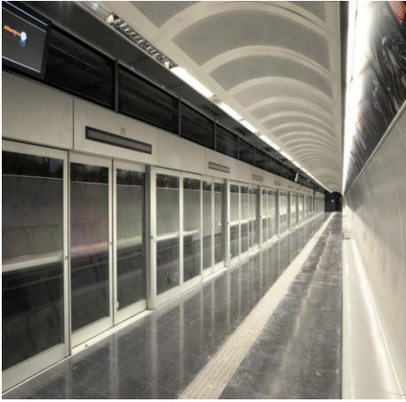
Andana estación Fondo.