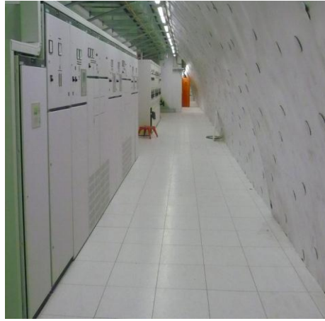
Sala de cuadros eléctricos.