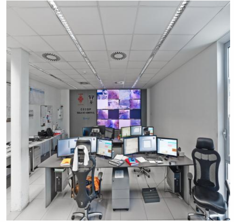
Sala de control.