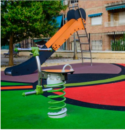
Àrea de jocs al carrer Gutierre Tibón.