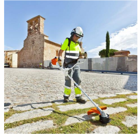
Iglesia de Sant Pere.