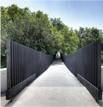
Puente a la zona del castillo.