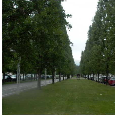
Zona verde Coll Favà.