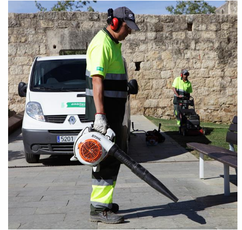
Monasterio de Sant Cugat.