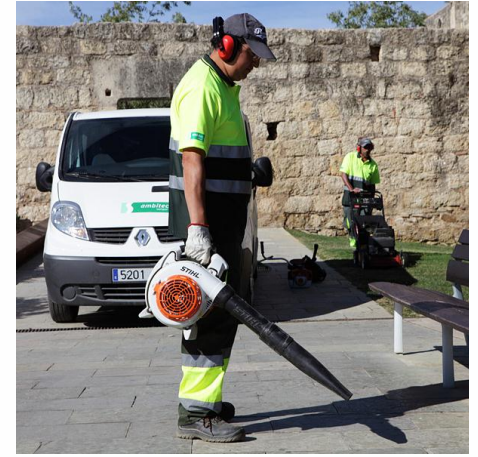
Monestir de Sant Cugat.