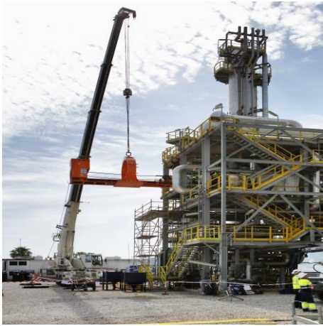
Desmontaje del haz de tubos del reboiler