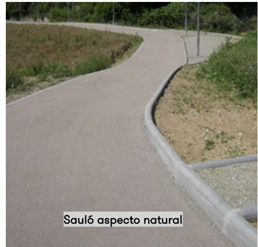
Sauló aspecto natural