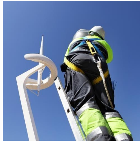
Manteniment de l'enllumenat exterior.