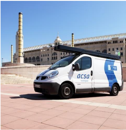
Vehicle adscrit al servei.